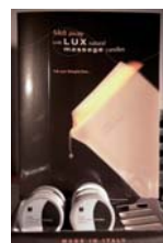
ESPO/CM2000V Retail display vuoto