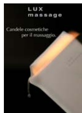
CART/LUX Cartello vetrina